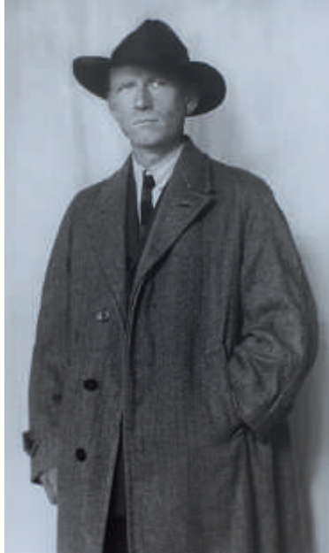
August Sander, Der Maler Otto Dix 1928, Silbergelatine