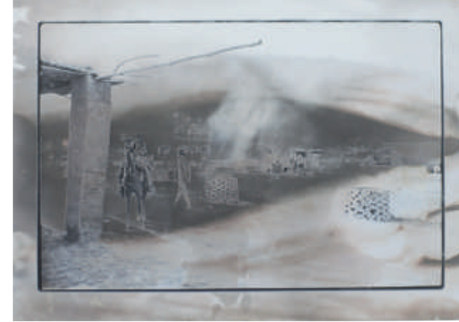
Sigmar Polke, Pakistan, 1974, Silbergelatine, Vintage

Abbildung links: Man Ray, Marcel Duchamp, 1916, Silbergelatine