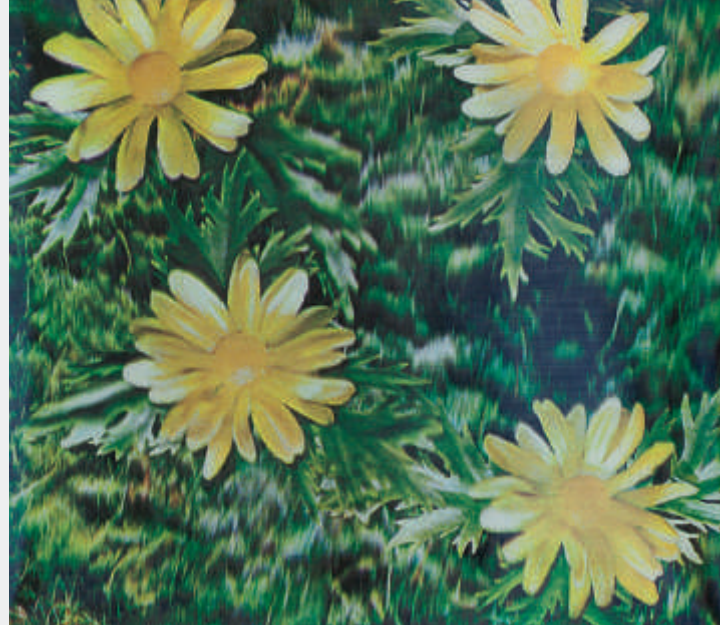
Andy Warhol, Rain and Flowers (Detail aus der gleichnamigen Installation in Osaka 1970) 1970, Xograph (3-D Aufnahme)