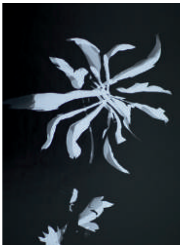
László Moholy-Nagy, Fotogramm, 1930, Silbergelatine