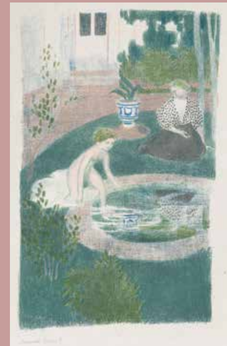
MAURICE DENIS Le reflet dans la fontaine Das Spiegelbild im Brunnen 1897 Farblithografie auf China