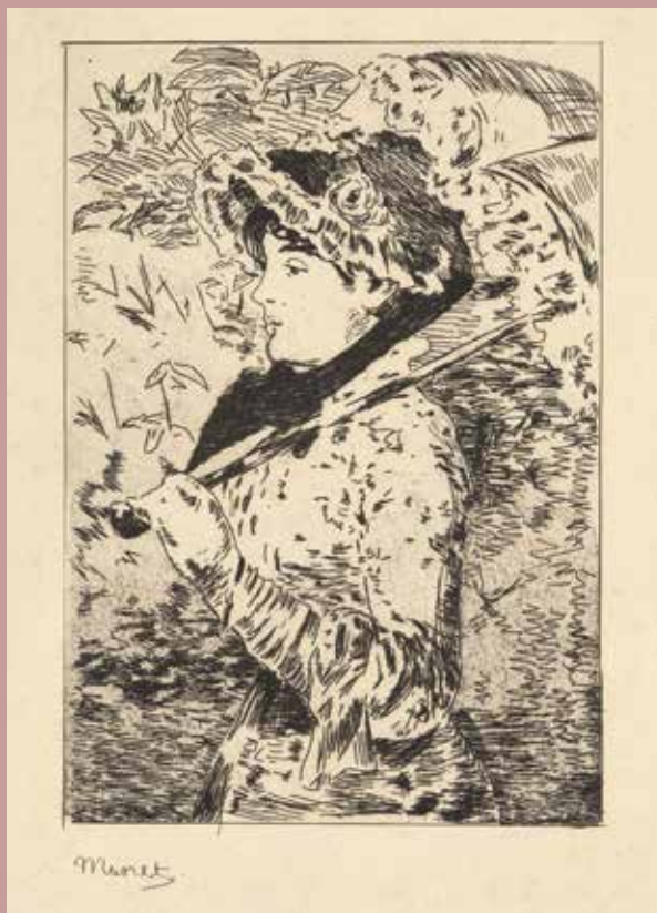
ÉDOUARD MANET Jeanne (Le printemps) Jeanne (Der Frühling) 1882 Radierung auf Büten

Städtische Galerie in der Reithalle Paderborn-Schloß Neuhaus