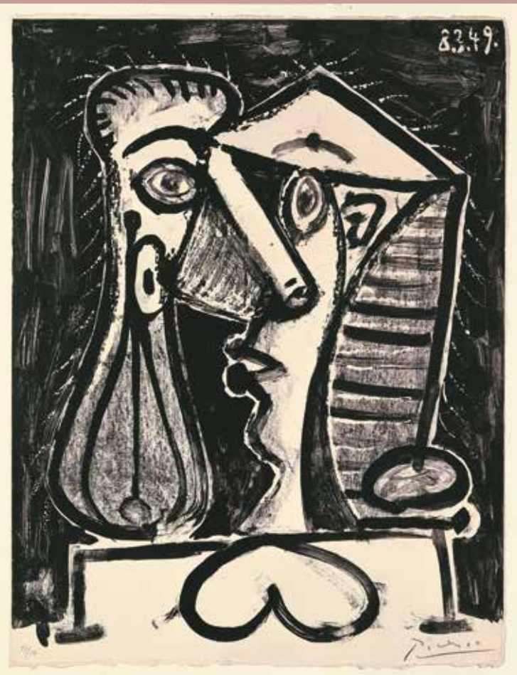
PABLO PICASSO Figure composée II Figürliche Komposition II 1949 Lithografie auf Velin d'Arches

EDGAR DEGAS Femme nue debout, à sa toilette / Stehender weiblicher Akt, sich abtrocknend, um 1890. Lithografie auf Velin